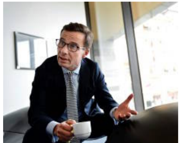
RENOVERING PÅ GÅNG. Ulf Kristersson, socialförsäkringsminister (M), funderar över förslag från fyra olika utredningar om förändringar i pensionssystemet.

Snabba och obekväma beslut, som höjd pensionsålder och avgiftstak, kanske inte är röstknipande men skulle väcka respekt och kanske återge det svenska pensionssystemet dess forna glans.